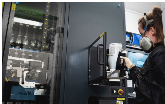
Das Team am neuen KI-gesteuerten Mischroboter – Präzision trifft auf Teamgeist

Eine der grössten Investitionen gilt einer neuen Farbmisch-Technologie mit Mischroboter, der mit KI gesteuert wird. Die Technologie vereinfacht die Arbeit der Mitarbeiter erheblich und steigert gleichzeitig die Qualitätsstandards bei der Fahrzeuglackierung. «Präzision und Effizienz gehen hier Hand in Hand», erklärt Repole.